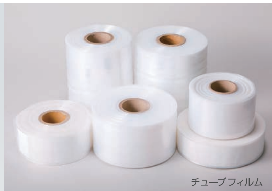
チューブフィルム